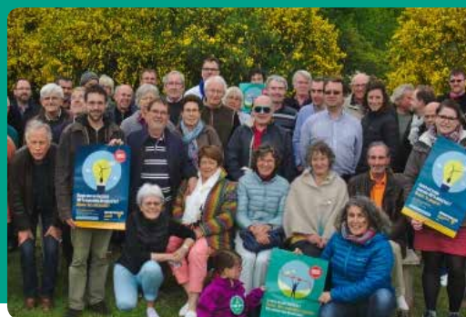
Assemblée générale 2017 d'Enercoop Bretagne