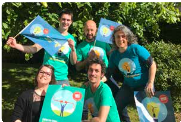
Équipe Enercoop Bretagne